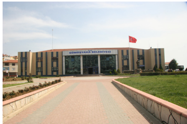
Gebäude der TAVAK-Stiftung in Silivri

versitäten will die Universität Istanbul auch ein großes Gebäude für sozialwissenschaftliche Fächer einrichten. Außerdem hat die Stadtverwaltung Silivri das ehemalige Gebäude des eingemeindeten Stadtteils Gümüşyaka (4.000 m 2 ) für die Hochschule zur Verfügung gestellt. In Kürze werden auf dem Gebäude zwei weitere Stockwerke angebaut, so dass ein Gebäude mit der Gesamtfläche von 8.000 m 2 für die Lehre und Veranstaltungen errichtet wird.