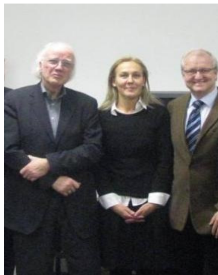
Vorstand des TAVAK-Fördervereins

TAVAK hat einen Tätigkeitsbericht für den Zeitraum Oktober 2008-Dezember 2009 erstellt. Bei Interesse melden Sie sich bitte per E-Mail ( tavak@tavak.de ).